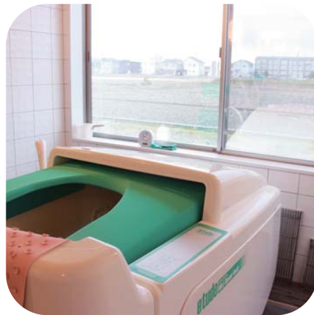
ミストシャワー浴

シャワー椅子に乗ったまま、全身にミストシャワーを浴びることができ身体も温まります